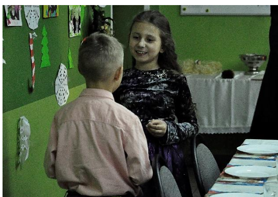
Po prawej: wręczenie prezentów „od Świętego Mikołaja” dla dzieci z najbiedniejszych rodzin.