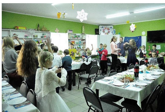
Po lewej: dzieci z Oratorium dzielą się opłatkiem. Po prawej: wspólne kolędowanie.