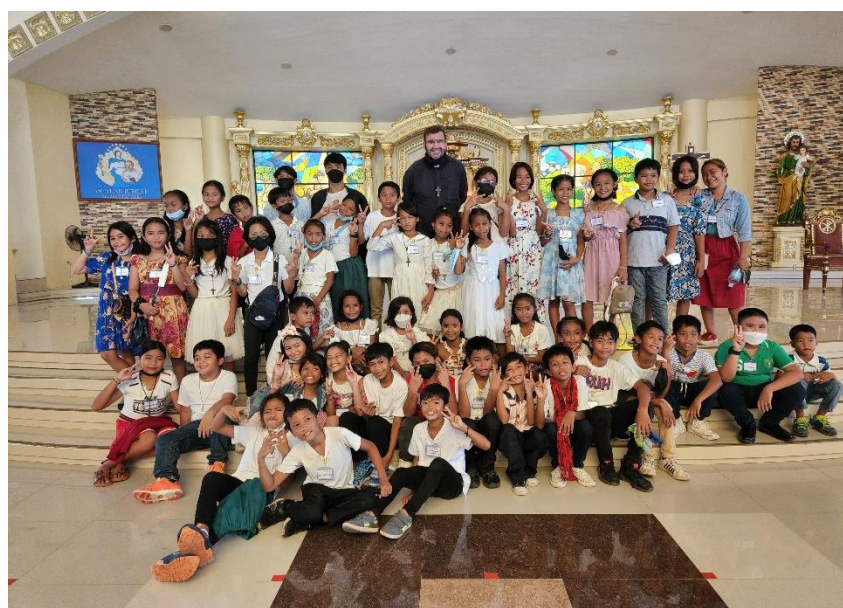
Misjonarze wraz z Podopiecznymi codziennie modlą się w intencji Darczyńców